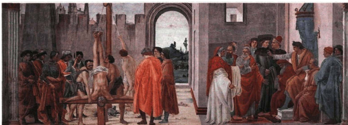
Рисунок 2. Филиппино Липпи. Капелла Бранкаччи, Санта Мариа дель Кармине, Флоренция. Фрагмент. Справа – диспут апостола Петра с Симоном Магом перед императором Нероном, слева – сцена распятия Петра. 1481-82 гг.

Наполненное мифологическими деталями противостояние волхва и апостола можно рассмотреть как борьбу двух общин, каждая из которых претендует на раскрытие «тайны жизни вечной». В то время как Петр верит, что спасительные дары Святого Духа даются благим Творцом чудесным образом через искупительную крестную жертву и покаяние человека в грехах, Симон Маг претендует на владение магическими методами и ритуалами, которые ведут к бессмертию и освобождению из-под власти слепого и чуждого человеку Создателя.