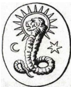
Рисунок 3. Вероятное изображение гностического Демииурга на гемме времен античности. См. Bernard de Montfaucon. L'antiquité expliquée et représentée en figures. - Paris, 1719-1724 гг.

сына, названного Иалдабаоф 373 . Он выглядит как змей с лицом льва и светящимися глазами. Незаконнорожденный сын крадет жизненную силу (δύναμις) у своей матери, благодаря чему приобретает способность творческой деятельности. Он перемещается во внешнюю от плеромы область и приступает к созданию земных материальных миров 374 .