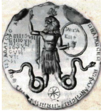
Рисунок 1. Гностическая гемма с изображением Абраксаса II век н.э.

Абраксас также упоминается христианскими апологетами. Так Ириней Лионский пишет про воззрения Сатурнина: