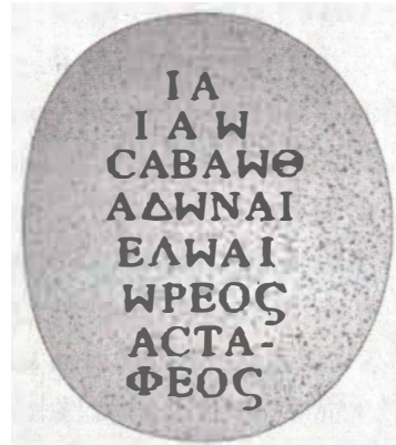
Рисунок 6. Гностическая гемма. Спереди: божество с человеческим телом и львиной головой с именами Иалдабаоф и Ариэль. Сзади: имена семи архонтов. Зеленая яшма.

Обратим внимание, что еврейская Гемара содержит сведения не только о Самаэле, но и о его жене – Аграт бат Махалат. Дьяволица неистово носится по воздуху в колеснице в сопровождении десяти тысяч вредоносных демонов и властвует над падшими земными душами. В иудейской мифологии Аграт иногда отождествляется с Лилит, первой женой Адама, которая бросила своего мужа и ушла именно к Самаэлю 459 . В Мишне как раз на Самаэля возлагается ответственность за искушение и грехопадение Евы (а также за убийство Каином Авеля) 460 . «Пиркей де-рабби Эли‘эзер» (Поучения рабби Элиезера бен Гиркана (80-118 гг.)) сообщает, что Самаэль обитал на небесах, а затем пал на землю, где принял образ змея и искусил Еву. Далее текст заявляет, что Самаэль соблазнил Еву, и именно от него она родила Каина 461 . Таргум Псев-